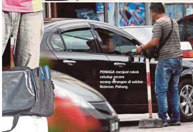
PENIAGA menjual rokok seludup secara terang-terangan di sekitar Kuantan, Pahang.

Rokok sah dipamerkan di rak namun sekiranya pelanggan mahukan rokok seludup, peniaga akan mengeluarkan barang dari bawah meja lipat atau yang disimpan dalam beberapa kotak saiz sederhana.