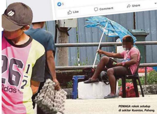
PENIAGA rokok seludup di sekitar Kuantan, Pahang.

Lokasi mana bro? Suka - Balas - 35w Most relevant is selected, so some replies may have been filtered out. Rokok Murah Malaysia Boss, Kita Hanya guna pos. Boleh Kirim ke mana mana je