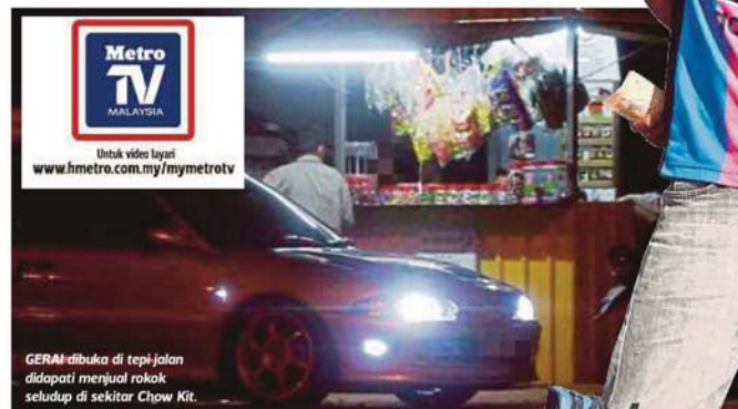
GERAI dibuka di tepi jalan didapati menjual rokok seludup di sekitar Chow Kit.

Hasil tinjauan mendapati, sekitar pasar malam harian terkenal di ibu kota antaranya bazar bundle di Chow Kit dan Lorong Haji Taib dengan jelas peniaga rokok seludup seolah-olah tidak gentar dengan undang-undang apabila menjalankan