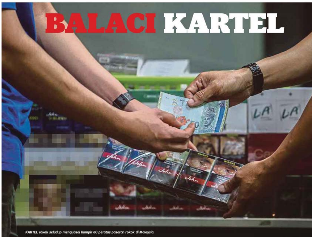
KARTEL rokok seludup menguasai hampir 60 peratus pasaran rokok di Malaysia.